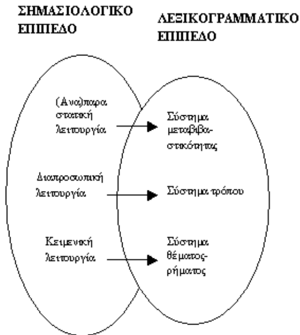
Σχήμα 2: Σχέση σημασιολογικού και λεξικογραμματικού επιπέδου