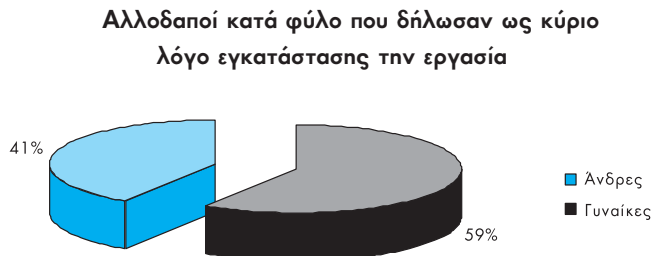
ΓΡΑΦΗΜΑ 2.1. Αλλοδαποί, κατά φύλο και κύριο λόγο εγκατάστασης την "εργασία"