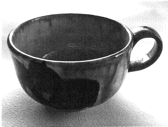
Κάτι που μοιάζει ασήμαντο, όπως μια μικρή πήλινη κούπα, μπορεί να γίνει η πηγή για πολλές και διαφορετικές ιστορίες.

ενσωματώνει περισσότερο προσωπικές έννοιες. Όπως επισημαίνει ο Mitchell (2011), τα φυσικά αντικείμενα «κουβαλούν μαζί τους κοινωνικές και ιστορικές αφηγήσεις» και επίσης «έχουν τη δυνατότητα να προκαλούν αυτοβιογραφικές αφηγήσεις» (σελ. 50). Μπορούν να εξυπηρετήσουν με τον ίδιο τρόπο που το κάνουν οι φωτογραφίες για να εκμαιεύουν εμπειρίες και ιστορίες από τον συμμετέχοντα σε μια έρευνα. Εάν βρίσκεστε στο σπίτι ή στον τόπο εργασίας ενός ατόμου και ρωτάτε για τα προσωπικά αντικείμενα που βλέπετε, είναι πιθανό να ακολουθήσουν μακρές συνομιλίες, που θα σας μεταφέρουν σε απρόσμενα μέρη.