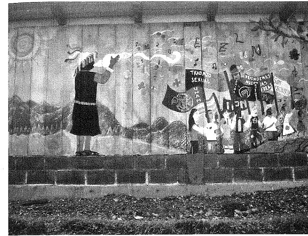
Σε αυτή την τοιχογραφία στο Oventik, στην πολιτεία Chiapas του Μεξικό, απεικονίζονται περιθωριοποιημένες και καταπιεσμένες ομάδες της κοινωνίας που οργανώνονται και συνασπίζονται υπό την αιγίδα του κινήματος των Zapatistas. Η τοιχογραφία περιέχει πολλά σύμβολα με βαθιές πολιτισμικές υποδηλώσεις, συμπεριλαμβανομένης της τοπικής ενδυμασίας του άντρα στα αριστερά και του κοχυλιού ή του κελύφους που φυσάει.

Οπτικά δεδομένα που δημιουργήθηκαν ή χρησιμοποιήθηκαν από τους συμμετέχοντες. Οι ερευνητές στις μελέτες επικοινωνίας και μέσων μαζικής ενημέρωσης επικεντρώνονται συχνά στα οπτικά δεδομένα (ταινίες, τηλεοπτικές εκπομπές, περιοδικά) που χρησιμοποιούν οι συμμετέχοντες στην έρευνά τους και αναλύουν με κάποιον τρόπο το περιεχόμενό τους. Οι εθνογραφικοί ερευνητές ωστόσο είναι πιο ικανοί στο να ζητήσουν φωτογραφίες που δημιουργούνται από συμμετέχοντες, ώστε να κατασκευαστεί με μεγαλύτερη πληρότητα το ιστορικό και πολιτιστικό πλαίσιο της μελέτης. Ο Peshkin (1978), για παράδειγμα, ζήτησε από τους κατοίκους της μελέτης που έκανε για τις αγροτικές σχολικές κοινότητες να του δείξουν τα οικογενειακά τους άλμπουμ φωτογραφιών, τα οποία μερικές φορές περιείχαν φωτογραφίες που χρονολογούνταν γύρω στα εβδομήντα χρόνια. Αυτές οι φωτογραφίες όχι μόνο αιχμαλώτιζαν το παρελθόν με έναν ιδιαίτερο τρόπο, αλλά χρησίμευσαν ως βάση για τη διαμόρφωση των συνεντεύξεων, υποδεικνύοντας θέματα που ο Peshkin δεν θα μπορούσε να είχε σκεφτεί εάν δεν τις είχε δει. Με τον όρο συνέντευξη με φωτογραφίες εννοούμε τη χρήση φωτογραφιών που παράγονται από τους συμμετέχοντες, για να «προκληθούν σχόλια, να ανασυρθούν μνή-