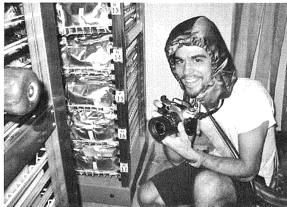
Φωτογραφίζοντας μια τράπεζα φυτικού γενετικού υλικού (σπόρων) στο Διεθνές Ερευνητικό Ίδρυμα Ρυζιού στις Φιλιππίνες.

Οι φωτογραφίες ακινητοποιούν ό,τι κινείται, και έτσι μπορώ να το δω καθαρά: τον χρόνο, τον τόπο, ένα βλέμμα, τη στάση ενός ατόμου, τις λεπτομέρειες (Τι εκφράζει το πρόσωπό της; Τι λένε τα μάτια του; Τι χρώμα είναι το φόρεμα που φοράει; Τι πουκάμισο φοράει αυτός; Τι είδους υλικό είναι; Φοράει σκουλαρίκια; Έχουν βέρες; Πώς είναι τα μαλλιά τους; Πώς είναι τα χέρια τους;). Όλα αυτά συνδυάζονται για να δώσουν ένα πορτρέτο, σε μαύρο και άσπρο, ενός προσώπου που αιχμαλωτίζεται σε μια συγκεκριμένη χρονική στιγμή... Οι φωτογραφίες παρέχουν μια άλλη προσέγγιση στη γνώση, που κυριολεκτικά με φέρνει πρόσωπο με πρόσωπο με τις ερωτήσεις μου και τις απαντήσεις τους (σελ. 60-61).