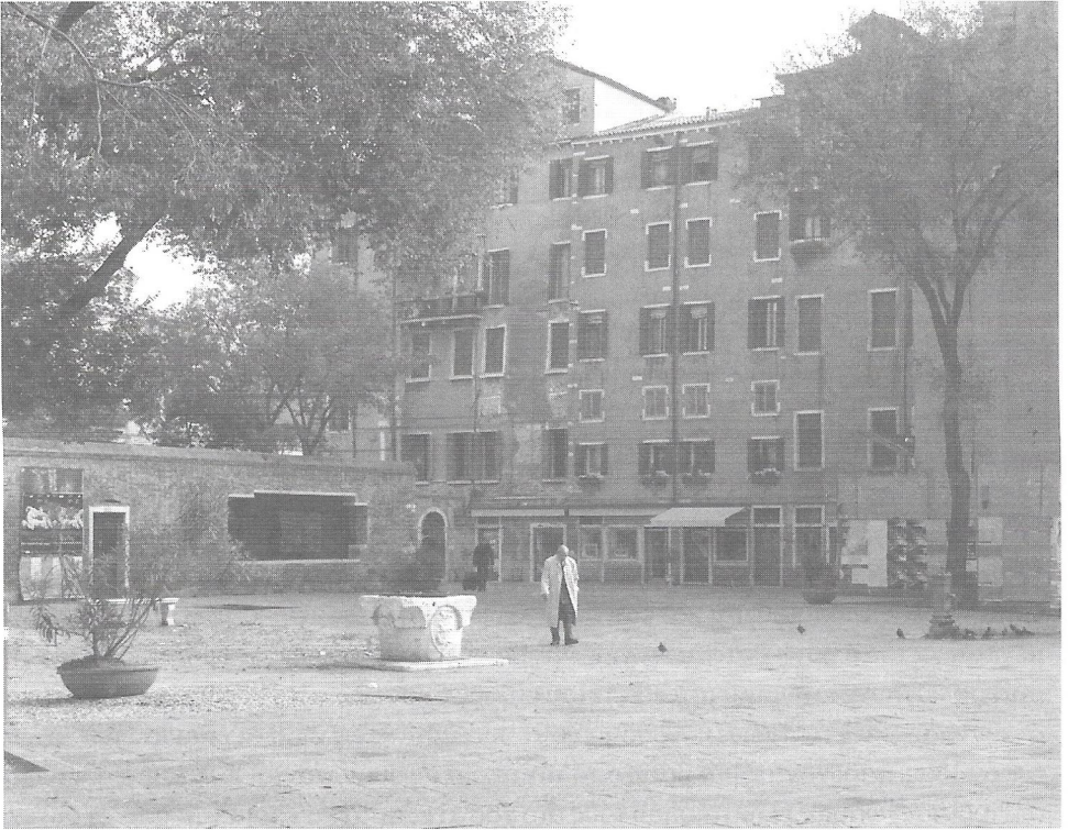
Το γκέτο στη Βενετία

πρόζει μια γενική ανοδική μεταβολή του κοινωνικοοικονομικού στάτους και ότι συνοδεύεται συνήθως από τη μεταφορά των εβραϊκών πολιτισμικών και θρησκευτικών θεσμών στα προάστια υποδηλώνει ότι αυτό το σχήμα είναι σε μεγάλο βαθμό αποτέλεσμα εκούσιου στεγαστικού διαχωρισμού. Έχει υποστηριχθεί ότι στην πραγματικότητα ο καταλληλότερος όρος για τις εβραϊκές συσσωματώσεις είναι η συσπείρωση παρά ο στεγαστικός διαχωρισμός (Waterman & Kosmin, 1988).