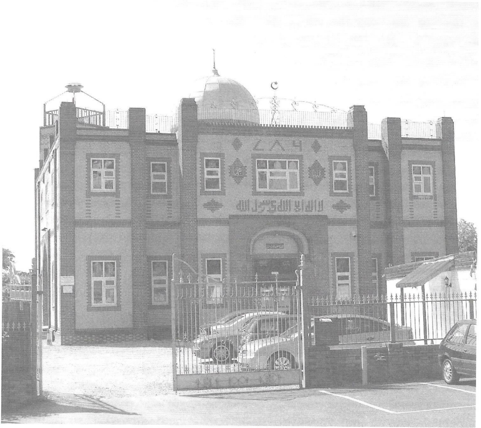
Το τζαμί Μεντίνα στο Σαουθάμπτον: Ένας ιερός τόπος που φανερώνει μια διακριτή υποκοουλτούρα.

στόχος είναι να κερδίσουν όσο το δυνατόν περισσότερα στο συντομότερο χρονικό διάστημα, και η ευκολότερη στρατηγική είναι η απασχόληση σε κάποια δουλειά με ωρομίσθιο, που επιτρέπει τις υπερωρίες και τη δεύτερη απασχόληση. Οι περισσότεροι όμως τείνουν να εγκλωβίζονται στη χαμηλότερη βαθμίδα της οικονομικής ιεραρχίας εξαιτίας ενός συνδυασμού θεσμικών και κοινωνικών διακρίσεων.