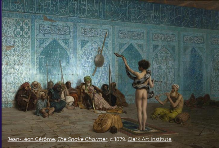
Jean-Léon Gérôme, The Snake Charmer , c. 1879. Clark Art Institute.

Edward Said (1978) μια κριτική μελέτη της δυτικής αντίληψης για το «εξωτικό» και πιο συγκεκριμένα για την Ανατολή