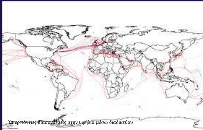
Υπερπόντιες διασυνδέσεις στην υφήλιο μέσω διαδικτύου

Ψηφιακή πολιτισμική γεωγραφία: άνοδος του διαδικτύου , των μέσων κοινωνικής δικτύωσης και των γεωγραφικών συστημάτων πληροφοριών (GIS) , όπου οι γεωγράφοι μελετούν την επίδραση των ψηφιακών χώρων στις πολιτιστικές πρακτικές και στη διαμόρφωση της ταυτότητας