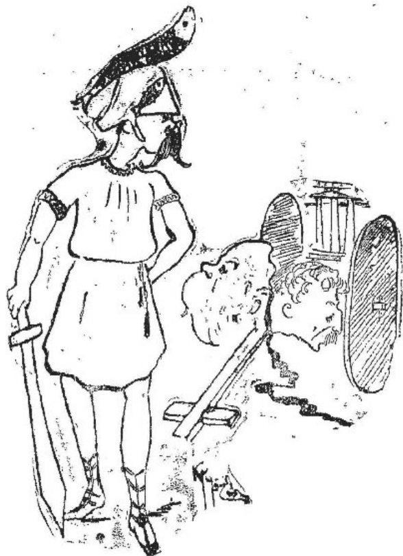
Ο ΜΕΓΑΣ ΑΛΕΞΑΝΔΡΟΣ

Ο όποιος αναμένεται να κόψει τον Γέρσον δεσμόν εν τη Κεουλή.