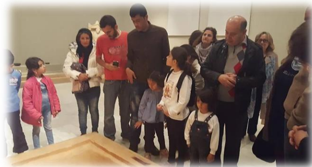
Σύροι πρόσφυγες ξεναγήθηκαν στο Αρχαιολογικό Μουσείο Βόλου