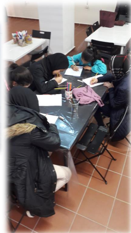
Μαθητές πρόσφυγες από το Δ.Ι.Ε.Π. 3ου Γυμνασίου Λάρισας στο Μουσείο Σιτηρών και Αλεύρων και το LAComics Festival