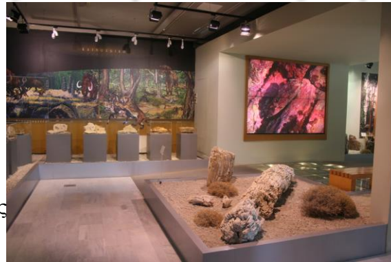
Ναυτικό Μουσείο Οινούσες

Δράσεις ενημέρωσης για πρόσφυγες πραγματοποιούνται στις εγκαταστάσεις του και το υπαίθριο Πάρκο Απολιθωμένου Δάσους Σιγρίου. Απευθύνονται σε ασυνόδευτους ανηλίκους, σε οικογένειες προσφύγων και ενηλίκους που φιλοξενούνται σε δομές της Λέσβου. Παρουσίαση με οπτικοακουστικό υλικό, με αναπαραστάσεις και πλούσιο φωτογραφικό υλικό, καθώς και την προφορική ενημέρωση από το επιστημονικό προσωπικό του Μουσείου, με παραστατικό τρόπο