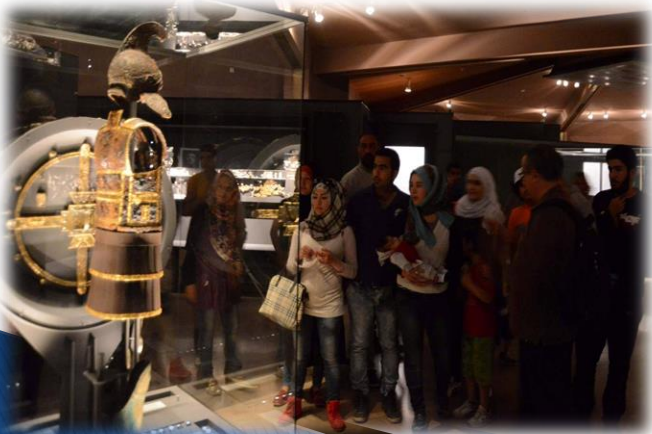
Σύροι πρόσφυγες οι πρώτοι επισκέπτες του Πολυκεντροικού Μουσείου Αιγών