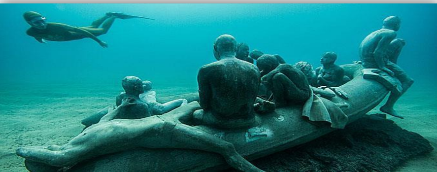
Μουσείο για τους πρόσφυγες στον βυθό της Ευρώπης-Museo Atlantico