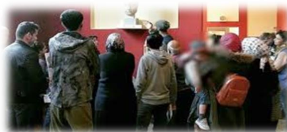
Επίσκεψη προσφύγων στο Αρχαιολογικό Μουσείο Σπάρτης