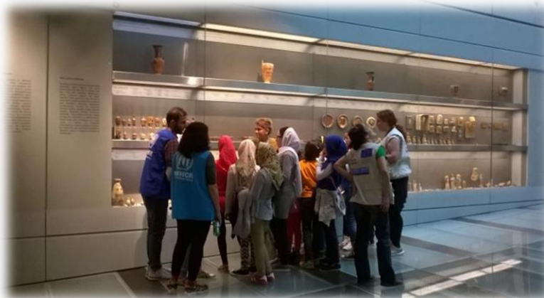
Επίσκεψη προσφυγόπουλων Κέντρου φιλοξενίας Σχιστού στο Μουσείο της Ακρόπολης