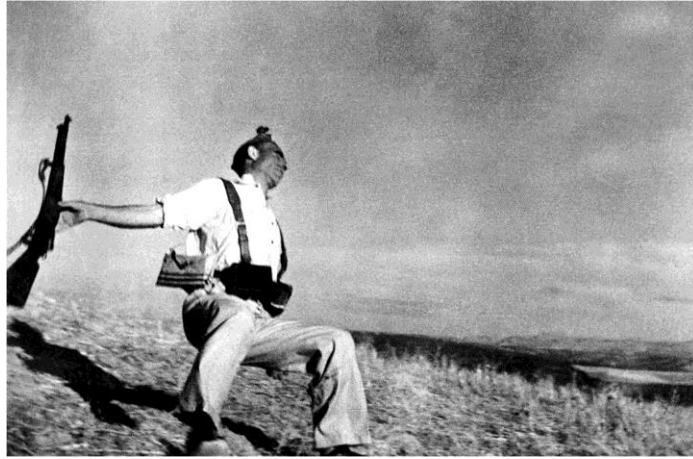
Η πιο κλασική φωτογραφία του εμφυλίου