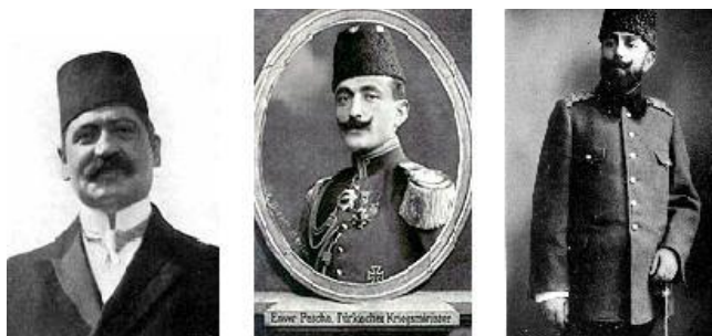
Η νεοτουρκική τριανδρία (Ταλάτ-Ενβέρ-Τζεμάλ).

Όμως, μετά το 1912 το νεοτουρκικό καθεστώς εκφυλίστηκε σ' ένα είδος στρατιωτικής δικτατορίας, η οποία τερματίστηκε με την ήττα της αυτοκρατορίας το 1918. Η στρατιωτική ήττα, η οικονομική καταστροφή και η πολιτική ανικανότητα εξανέμισαν το ηθικό και την αφοσίωση ακόμα και των πιο πιστών οπαδών τους.