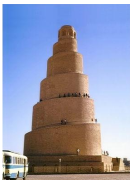
Μεγάλο Τέμενος Σαμάρρα, Ιράκ

Επί βασιλείας του Χαρούν αλ-Ρασίντ (786-809) η δυναστεία έφτασε στο απόγειο της ισχύος της. Ο ίδιος ο χαλίφης έγινε προστάτης των γραμμάτων και των τεχνών και στο χαλιφάτο άνθισε ένας πρωτόγνωρος πολιτισμός. Επρόκειτο για το χρυσό αιώνα του μουσουλμανικού κόσμου (εποχή της raha islamica ). Το έργο του συνέχισε ο αριστοτελικός αλ-Μαμμούν (813-33), ο οποίος χρησιμοποίησε τον τίτλο Ιμάμ. Ο επόμενος χαλίφης, αλ-Μουτάσιμ , οργάνωσε προσωπικό στρατό από Μαμελούκους (Τούρκους μισθοφόρους), εισάγοντας το κεντροασιατικό στοιχείο στη Μέση Ανατολή. Με τον χαλίφη αυτό αρχίζει η παρακμή του χαλιφάτου. Από το 940 και μετά ο χαλίφης είναι πρόσωπο με συμβολική ισχύ και η πραγματική εξουσία έχει περάσει σε τοπικούς ηγεμόνες, που ιδρύουν κληρονομικά εμιράτα.