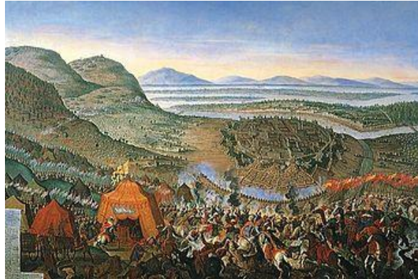
Η 2 η πολιορκία της Βιέννης

Με την ειρήνη του Κάρλοβιτς (1699) η Ποδολία επιστράφηκε στην Πολωνία και οι αυστριακές κτήσεις στην Ουγγαρία επικυρώθηκαν. Η συνθήκη αυτή έχει ξεχωριστή σημασία στην ιστορία της οθωμανικής αυτοκρατορίας ως η πρώτη ειρήνη που υπογράφηκε από την ηττημένη αυτοκρατορία με τους νικηφόρους χριστιανούς αντιπάλους της. Συγκεκριμένα η συνθήκη είχε ως συνέπεια την υποβάθμιση της οθωμανικής επιρροής στα πράγματα της νοτιοκεντρικής Ευρώπης και την ισχυροποίηση της Αυστρίας στην ευρύτερη περιοχή.