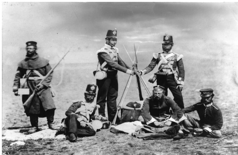
Οι πρώτες φωτογραφίες από πόλεμο - Κριμαϊκός (Βρετανοί στρατιώτες ξεκουράζονται)