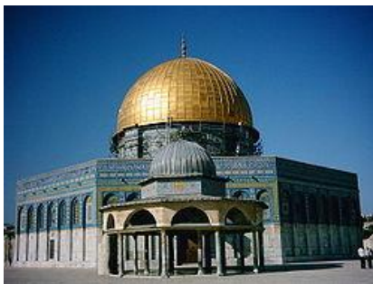
Ο Θόλος του Βράχου (εκεί έγινε η θυσία του Αβραάμ) Ιερουσαλήμ

Πολιτισμός: Ο πρώτος αραβοϊσλαμικός πολιτισμός αναπτύχθηκε βασισμένος στο συροβυζαντινό. Στη Δαμασκό άνθησαν οι θεολογικές αναζητήσεις ανάμεσα στους μουσουλμάνους και τους χριστιανούς (τότε αναδείχθηκε ο Ιωάννης ο Δαμασκηνός). Επίσης αναπτύχθηκε η αρχιτεκτονική των τεμενών (Θόλος του Βράχου, τέμενος της Μεδίνα, το περίφημο τέμενος της Δαμασκού) και η αρχιτεκτονική και η διακόσμηση με νατουραλιστικά θέματα των ιδιωτικών χώρων (παλατιών, σπιτιών). Η επικράτηση των Αμπασιδών επέφερε την εξάλειψη των μνημείων πολιτισμού των Ομευαδών, από τα οποία έχουν μείνει μόνα λίγα κυρίως θρησκευτικά μνημεία.