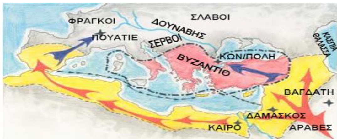
Η επέκταση των Αράβων στη Μεσόγειο