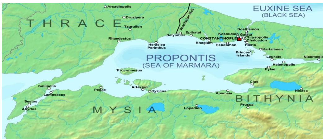
Η Πόλη και τα περίχωρά της κατά τη βυζαντινή εποχή

Στα χρόνια του αυτοκράτορα Ηράκλειου (610-641) ενοποιήθηκαν οι αραβικές φυλές και δημιούργησαν θεοκρατικό κράτος (χαλιφάτο). Κατέλυσαν την περσική αυτοκρατορία και συγκρούστηκαν με τους Βυζαντινούς καταλαμβάνοντας τεράστιες εκτάσεις στην Ασία και τη Β. Αφρική. Από τον 7ο αιώνα αραβικοί στόλοι άρχισαν τις επιδρομές στην Κύπρο, τη Ρόδο, την Κρήτη, τη Σικελία, τη Θεσσαλονίκη και άλλα νησιά και λιμάνια της βυζαντινής αυτοκρατορίας, ενώ πολίorkησαν και την Κωνσταντινούπολη (717-8 επί Λέοντα του Ίσαυρου).