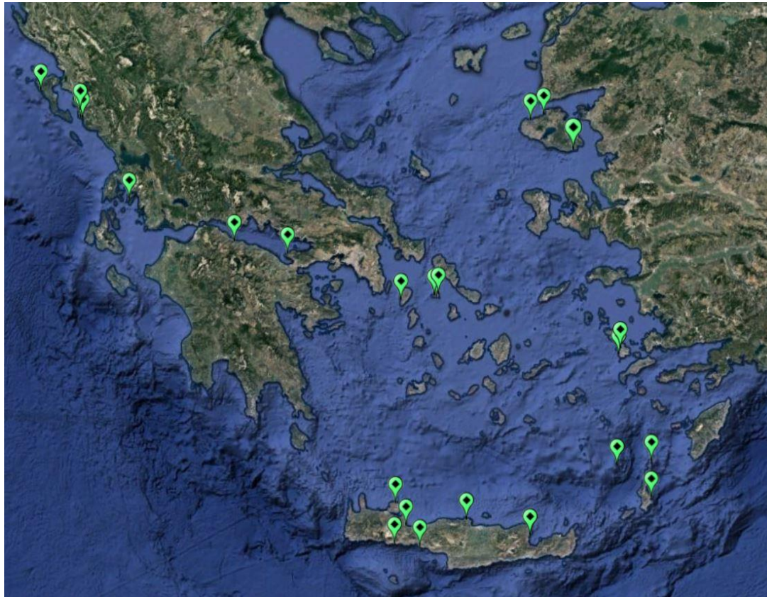
Εικόνα 1: Χάρτης 27 σταθμών