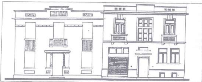
Όψεις κατοικιών του συνεταιριστικού συνοικισμού Τυρολόης - Ικονίου έξω από τα δυτικά τείχη της Θεσσαλονίκης (δεκαετία του 1930, σήμερα έχουν κατεδαφιστεί).

Ο τρόπος κατασκευής των συνεταιριστικών συνοικισμών, που βρίσκονταν υπό την εποπτεία της Πρόνοιας, εξασφάλιζε καλύτερη ποιότητα οικιστικού περιβάλλοντος και κάποια ιδιαίτερη αρχιτεκτονική ταυτότητα. Ειδική επιτροπή από υπαλλήλους που όριζε η Πρόνοια, κατάρτιζε το σχέδιο του συνοικισμού και ενέκρινε τους τύπους και τη μορφή των κατοικιών, η ανέγερση των οποίων γινόταν είτε απευθείας από τους ιδιώτες είτε από οικοδομική εταιρεία. Από οικοδομικούς συνεταιρισμούς αναγέρθηκαν συνοικισμοί κυρίως στην Αθήνα και τη Θεσσαλονίκη.