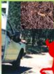
Ρυθμι αναρρόφησης απορριμμάτων και σπαστών