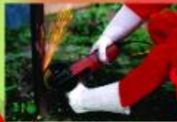
Χρήση ηλεκτρικών εργαλείων

Προστάτεψε το Δάσος... Προστάτεψε τη Ζωή σου