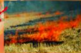
Κόψιμο αποκομμένων κλαδιών και άλλων ξηρών κλάδων