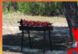
Εστιασίο φωτιάς στο δάσος εκτός των προειδοποιημένων ζωνών

Μην αφήσεις τον κακό δαίμονα της φωτιάς να καταστρέψει το δάσος