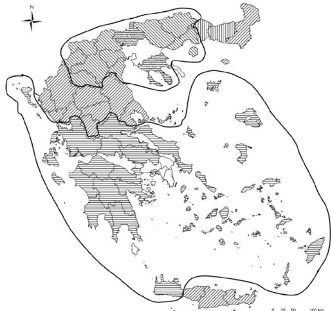
Χάρτης 2: Οι κατευθύνσεις των μεταναστευτικών ρευμάτων