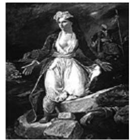
Η Γαλλία και η Ελλάδα του Delacroix