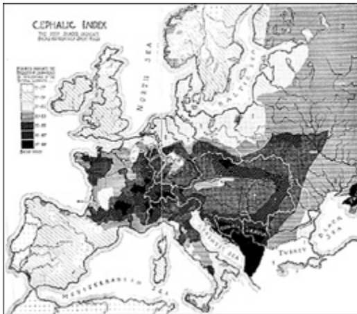
Χάρτης 1: Κρανιομετρία στην Ευρώπη.

Οι διακρίσεις ανάμεσα στα έμβια είδη είναι χρήσιμες σε επιστήμες όπως η ζωολογία· δεν έχουν όμως τίποτα να προσφέρουν στις ανθρωπιστικές και στις κοινωνικές επιστήμες. Αναλογιστείτε απλώς τις διάφορες «φυλές» που προβάλλονται κατά καιρούς και τον δύναμι άπειρο αριθμό «διασταυρώσεων» μεταξύ τους. Σε ποια φυλή ανήκουν οι απόγονοι; Βι-