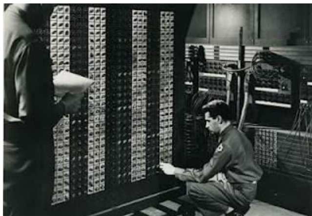
Εικόνα 2.1 : ENIAC, ο πρώτος υπολογιστής