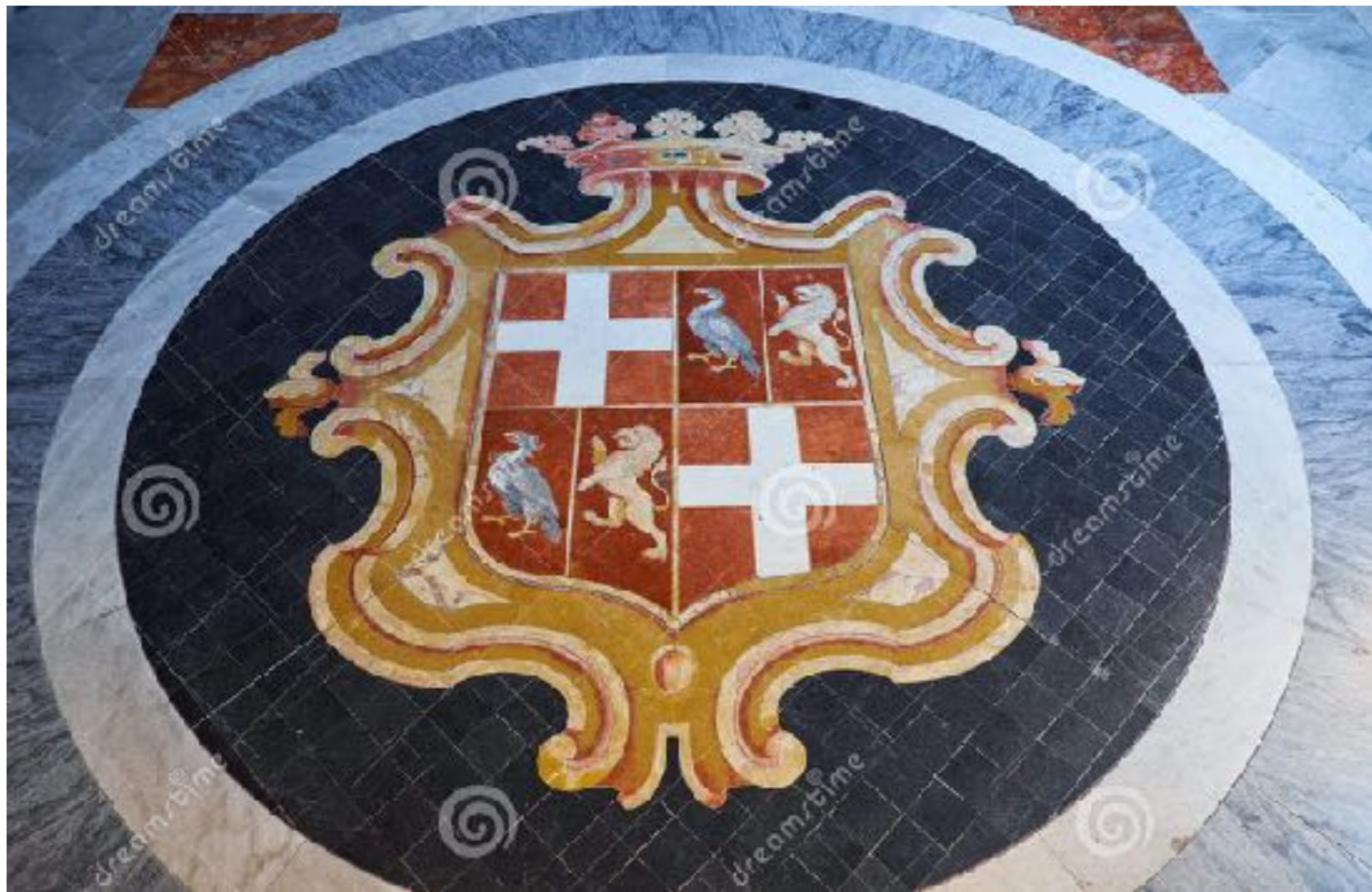
Mosaic floor decoration with the coat of arms of Jean Parisot de Valette, the Grand Master of the Order of St. John. Grandmaster's Palace. Valletta. Malta